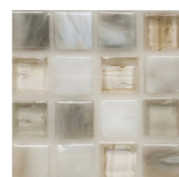
15角モザイクタイル (BIMG-1011)