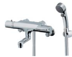
サーモシャワー水栓 2mホース