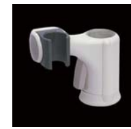
スライドシャワーフック